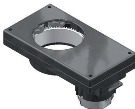
SERIE 671 AC

I nostri distributori bicchieri Serie 671 sono dispositivi automatici per la dispensazione di bicchieri in plastica o carta. Sono disponibili diverse versioni per dispensare bicchieri di diverso diametro.