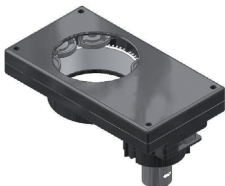
SERIE 671 DC