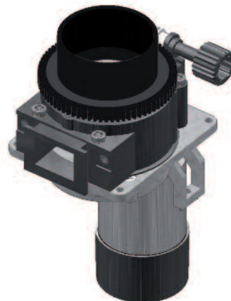
SERIE 252 DC-24V

I macinacaffè sono dispositivi per la macinatura dei chicchi di caffè con la possibilità di impostare la granulometria desiderata (da fine a grossolana) a seconda delle esigenze. Il caffè macinato può essere dispensato con dosaggio a tempo o attraverso il nostro dosatore volumetrico Serie 253 . Tutti i modelli possono essere accoppiati alla gamma di Tramogge caffè Serie 29X .